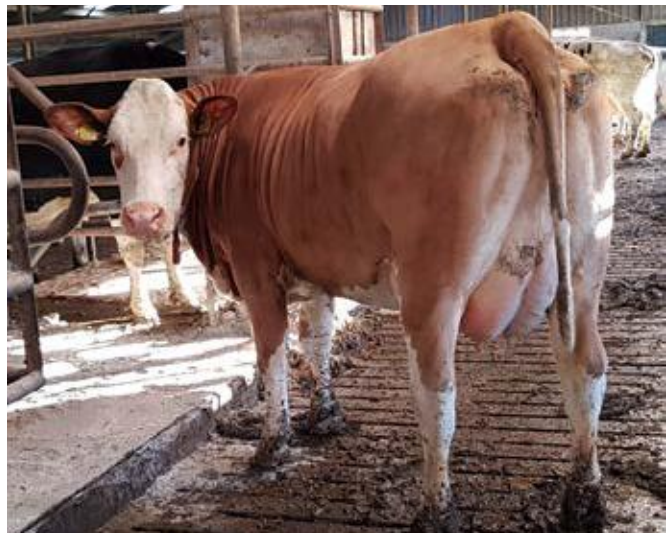
BFG Mahango Pp dochter Esther 6.