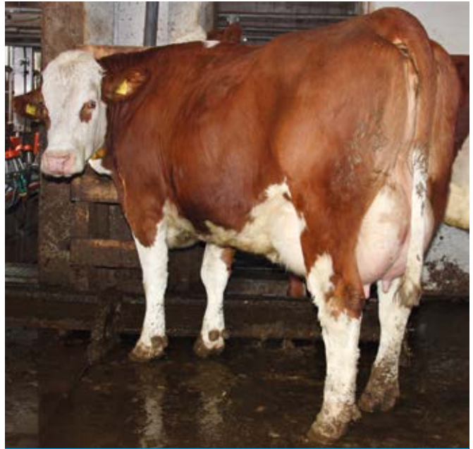
Morle als tweedekalfs.