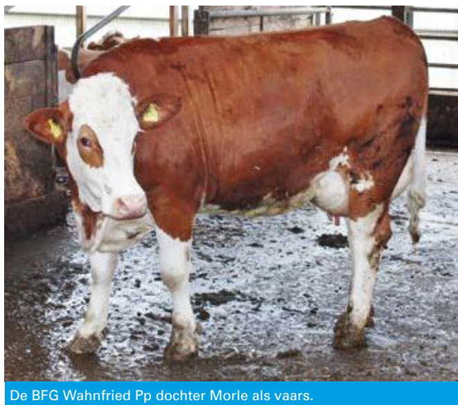
De BFG Wahnfried Pp dochter Morle als vaars.