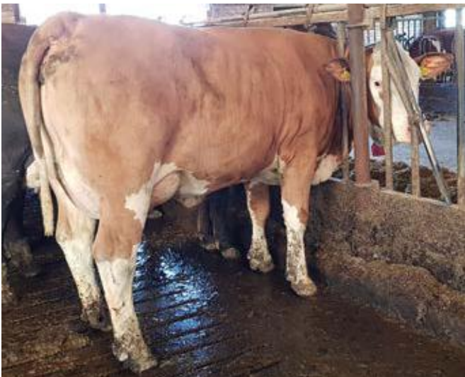
Mahangodochter Esther 6 is ook fraai tijdens het eten.